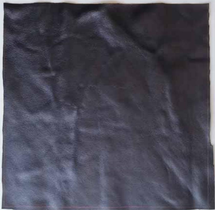
● Campione A