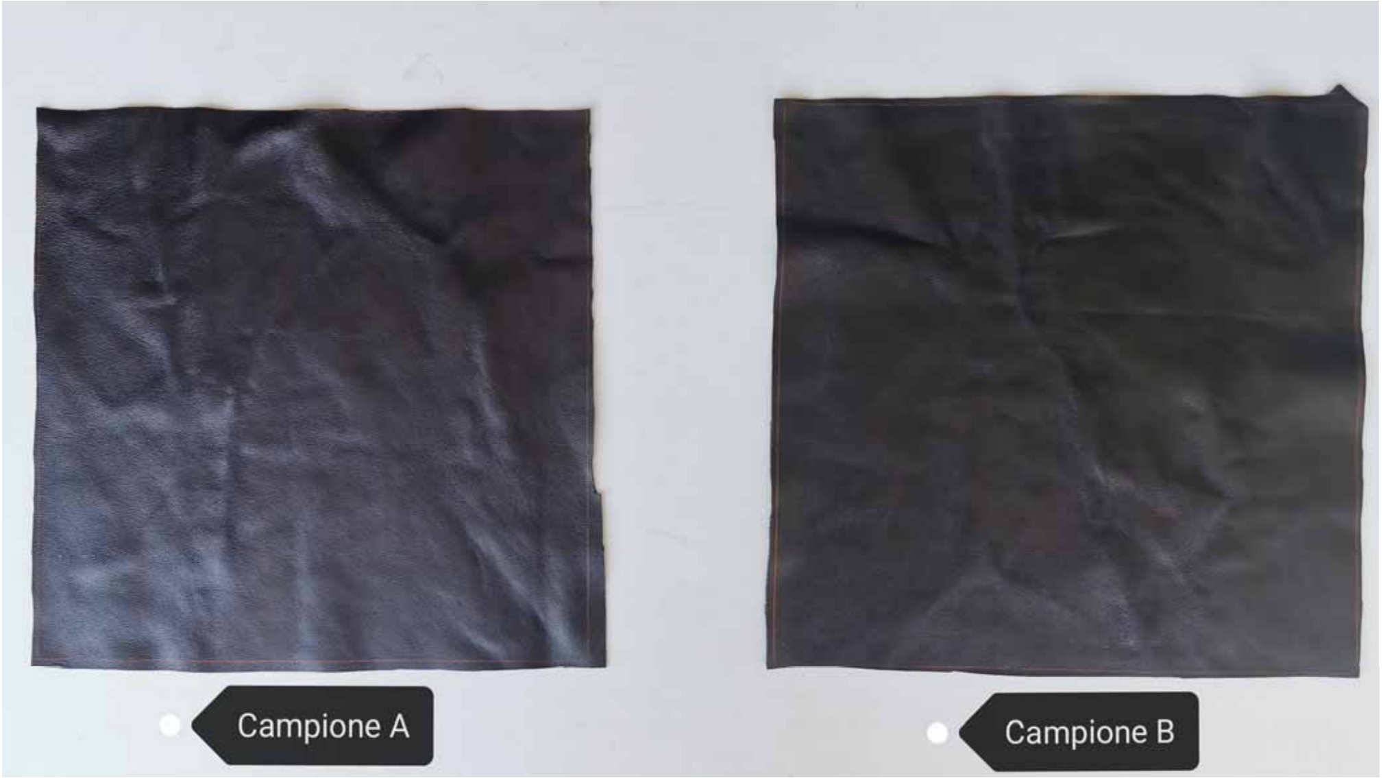
● Campione A