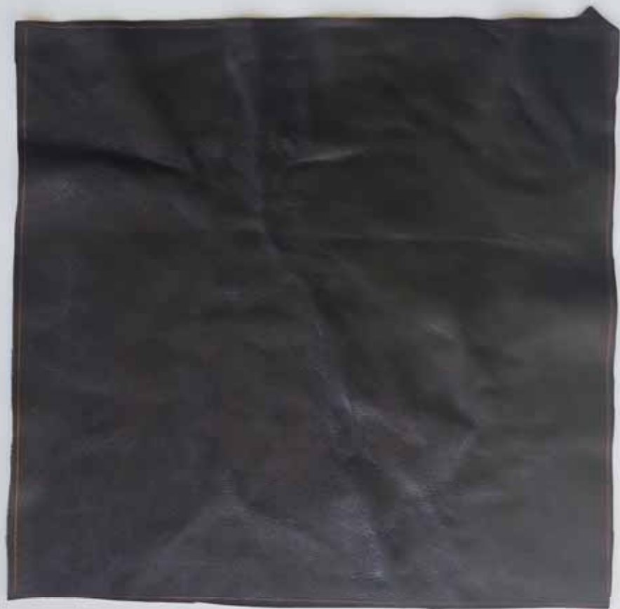
● Campione B